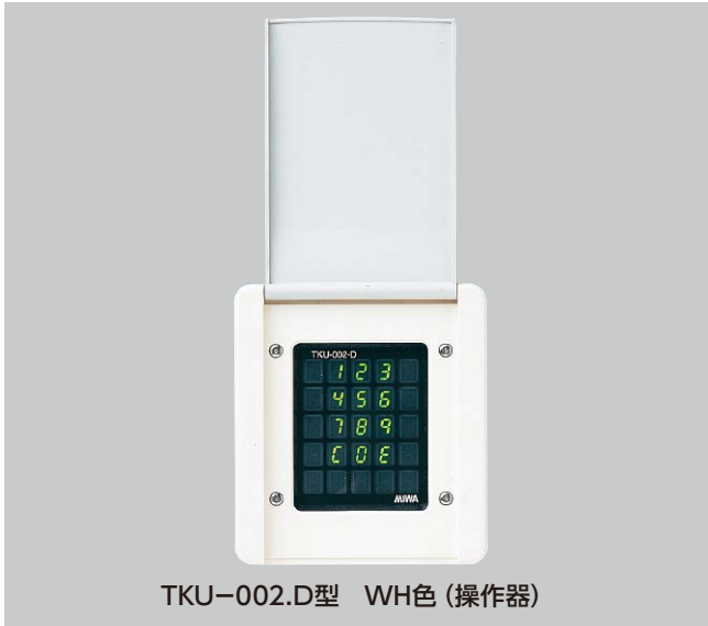
TKU-002.D型 WH色 (操作器)

型 ■用途:住宅/マンション/寮/ビル/病院等 ■納期:標準納期品 ● 制御器は屋内仕様