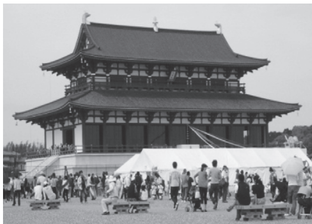
2010年に開催された「平城遷都1300年祭」天平行列と大極殿