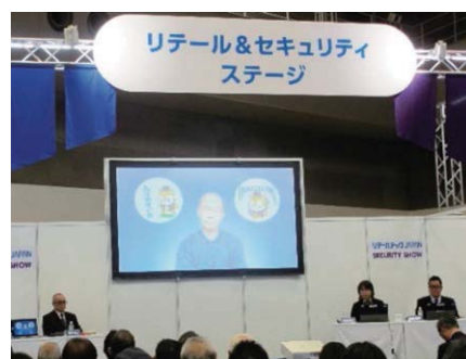
SECURITY SHOW セミナーステージ