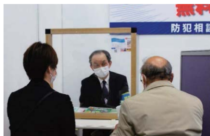
防犯相談コーナー