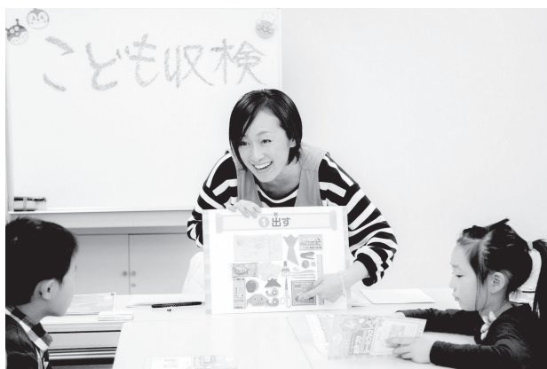
こども収納検定 風景

元々は東日本大震災や悲しい事件報道を通して「自分と家族の命は人任せでは守れない」と感じたことから始まったものですが、子育て中の親御さんが想像以上に私と同じような不安や悩みを持っていることを知り「各家庭に届くメッセージをわかりやすく発信したい」と、大変地味ですが等身大の活動を続けています。