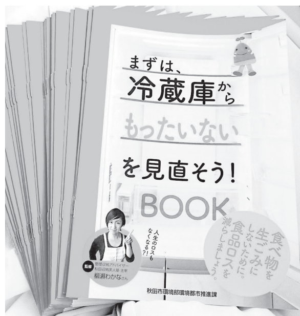
冷蔵庫収納リーフレット監修