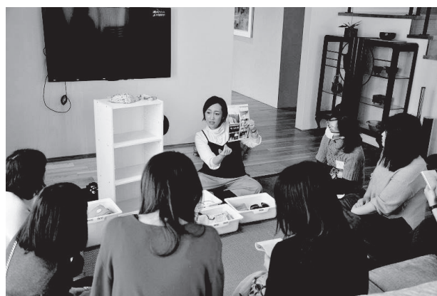
ママ向けお片付けレッスン風景

先述の事件では児童センター周辺に防犯カメラがなく（ダミー1ヶ所のみ）、同時間帯に子供を迎えに来ていた複数の保護者のドラレコ映像から犯人を特定できたそうですが、それがなければ解決できなかったかもしれない可能性を思うと、やはり地域にもっと防犯カメラが増設されてほしい！そんな思いから、家族防犯ネタの“インスタ不意打ち投稿”も続けていたりします。