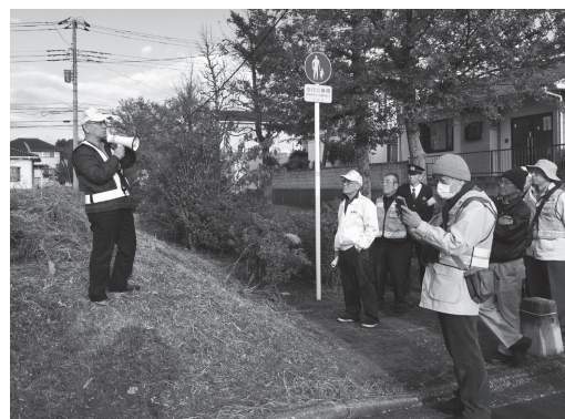
防犯講話でのパトロール風景

これからも、安全安心な場面(住居・店舗・地域)づくりの活動に、一防犯設備士として、貢献したいと考えております。引き続き、日防設、千防設、そして縁ありお会いした方々、皆様からご指導賜りますよう、よろしくお願いいたします。